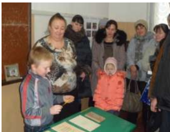
Экскурсия для родителей.