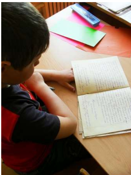
Работа с музейными экспонатом.

Одна из них посвящена сельскому учительству. В процессе исследовательской работы собраны архивные и другие материалы из истории школы, данные о первых учителях и работающих далее. Также собран материал об учительских династиях земли тверской и рамешковской, о начальных школах нашего округа, чтобы не предать забвению эти «островки педагогической деятельности».