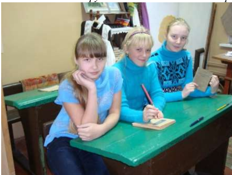
За партами участники краеведческой конференции.

Созданы экспозиции с предметами быта «Рабочий стол учителя», «Кухонный уголок». Продолжается работа над проектом «От музейного уголка сельского учительства – к музею педагогической славы». Каждый экспонат –