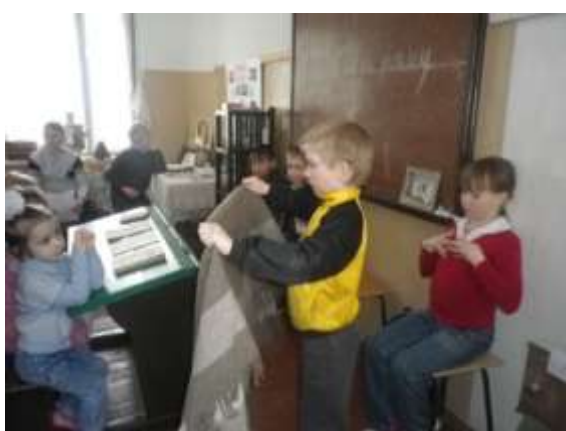
Экскурсия для воспитанников дошкольной группы.