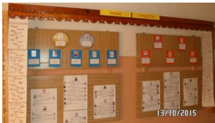
"Наша гордость" - одна из экспозиций музейного уголка

В этом же зале создана экспозиция «Природа родного края», в которой представлены палеонтологические находки.