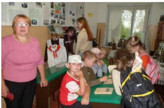
Экскурсия для детей из с. Замытье